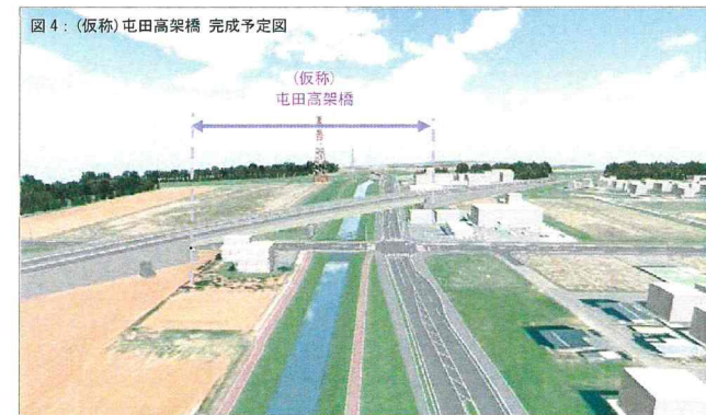
図4：（仮称）屯田高架橋 完成予定図