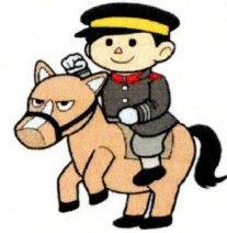
屯田連合町内会 公認キャラクター 「屯田兵さん」