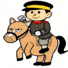
屯田連合町内会 公認キャラクター 「屯田兵さん」