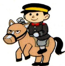
屯田連合町内会 公認キャラクター 「屯田兵さん」